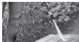
LAVER AVEC UNE PRESSION DE 3000 PSI