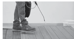
APPLIQUER SANSIN SDF AU PINCEAU OU AU PISTOLET