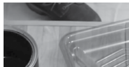
BIEN MÉLANGER AVANT ET PENDANT L'APPLICATION