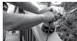
PONÇAGE AVEC UN PAPIER ABRASIF DE CALIBRE 60-80